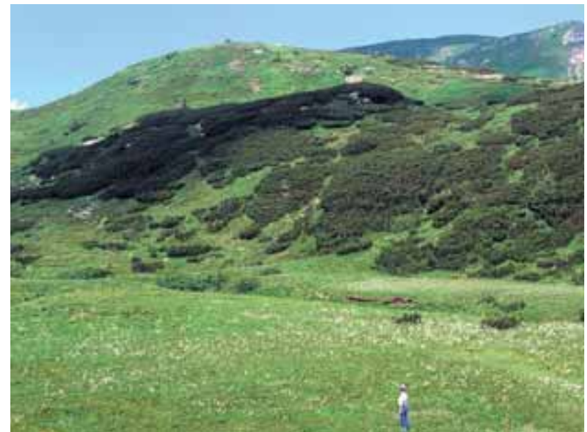
Torbiera del piano alpino