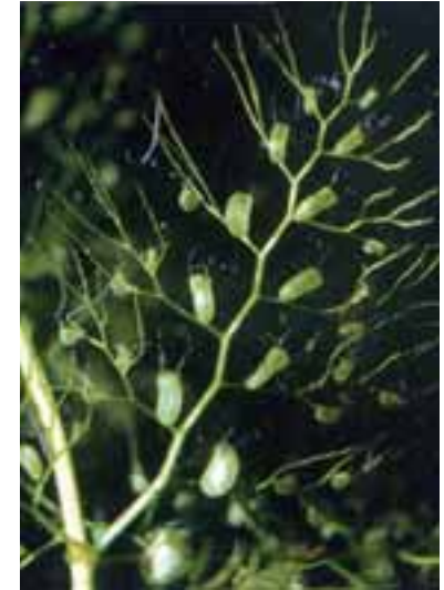
Erba vescica minore ( Utricularia minor )