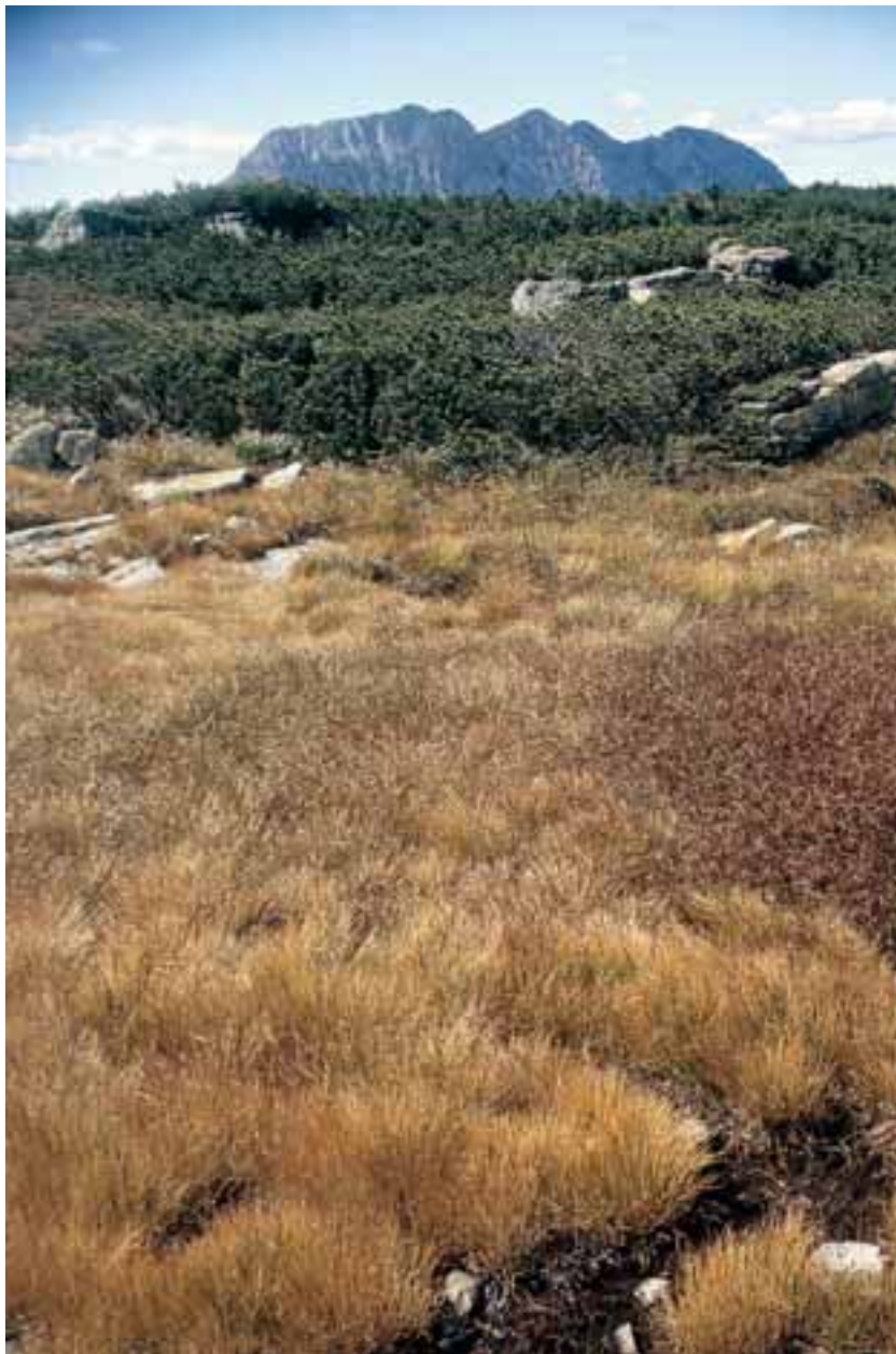
Torbiera alta nell'area della Creta d'Aip (Friuli Venezia Giulia)