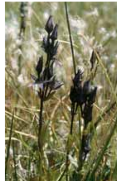
Genzianella stellata ( Swertia perennis )

● DD (dati insufficienti): entità per le quali non esiste documentazione in merito all'ampiezza dell'areale di distribuzione e alle dimensioni della popolazione; questo status non costituisce quindi una dichiarazione di rischio effettivamente esistente, che potrebbe comunque essere ipotizzato, ad esempio, in base alle preferenze ecologiche o a problemi riproduttivi dell'entità stessa, ma indica la necessità di indagini più estese ed