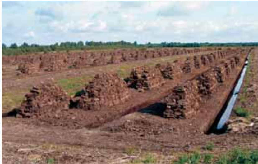
Un esempio relativo alla lavorazione della torba

Se è vero che in un'isola molto piccola e molto remota le probabilità di estinzione, per una qualsiasi delle specie ivi residenti, è sempre elevata, dal momento che non vi è spazio per lo sviluppo di popolazioni molto numerose, così come è vero che le probabilità di colonizzazione sono molto basse, data da distanza dai possibili "serbatoi" di propaguli, è facile allora capire quanto drammatiche siano le prospettive di sopravvivenza per il popolamento ani-