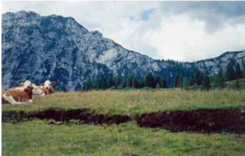
L'attività di pascolo può condizionare la composizione floristica delle torbiere

Nel paesaggio tradizionale della montagna l'allevamento del bestiame e la selvicoltura hanno frequentemente convissuto, con esiti alterni, con le vegetazioni di torbiera, spesso condizionandone la composizione floristica anche attraverso pratiche gestionali (drenaggio, incendio, ecc.) che tendevano indirettamente a trasformarle in modo sostanziale senza però pregiudicarne la sopravvivenza. Il pascolamento costituisce un rischio soprattutto quando la