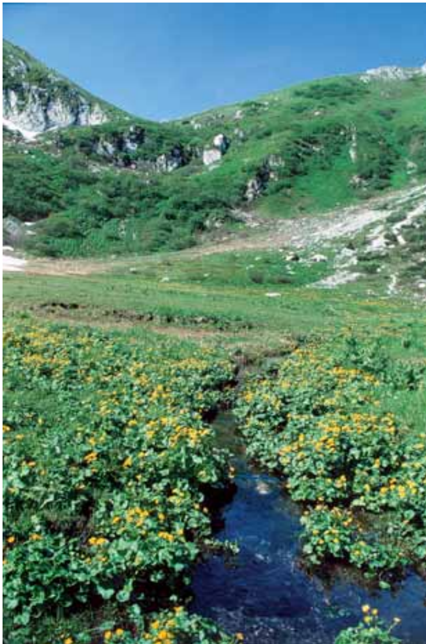
L'area inondata al bordo di una torbiera alpina (Alpi Carniche, Friuli)

che riportano i siti più antichi (paleolitici, mesolitici e neolitici), e di carte topografiche a scala adeguata (da confrontare con le precedenti) in cui siano riportate le torbiere e le aree umide in generale.