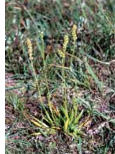
La tajola comune ( Tofieldia calyculata ) è inserita nella lista rossa delle piante italiane a rischio

A livello nazionale, dopo la storica realizzazione dei due volumi dedicati al "Censimento dei biotopi di interesse nazionale meritevoli di conservazione" editi alla fine degli anni '70, negli ultimi tempi sono fiorite numerose iniziative promosse dal Ministero dell'Ambiente, Servizio Conservazione della Natura, che hanno portato alla pubblicazione della Lista Rossa nazionale, di quelle regionali delle specie rare e minacciate d'Italia e, in collaborazione con la Società Botanica Italiana, al censimento degli habitat di interesse comunitario, in applicazione della direttiva CEE 92/43.