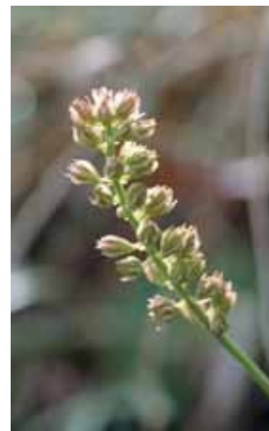
Tajola comune ( Tofieldia caliculata )