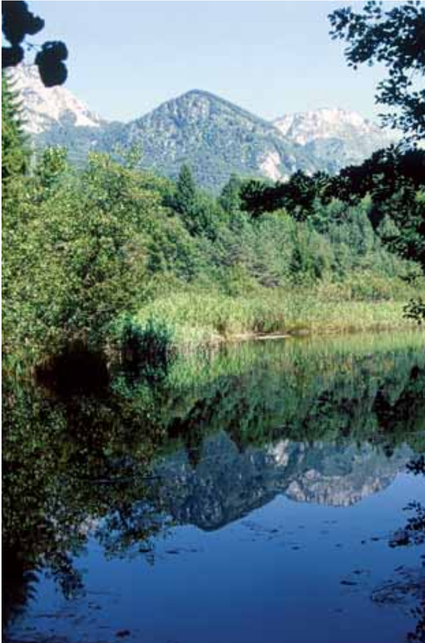
Lo stagno al bordo della torbiera di Cima Corso (Friuli)

7. Approfondimento sulle civiltà cui vengono riferiti i siti individuati, in particolare sulle tipologie degli insediamenti (attraverso libri di testo e altro materiale bibliografico).