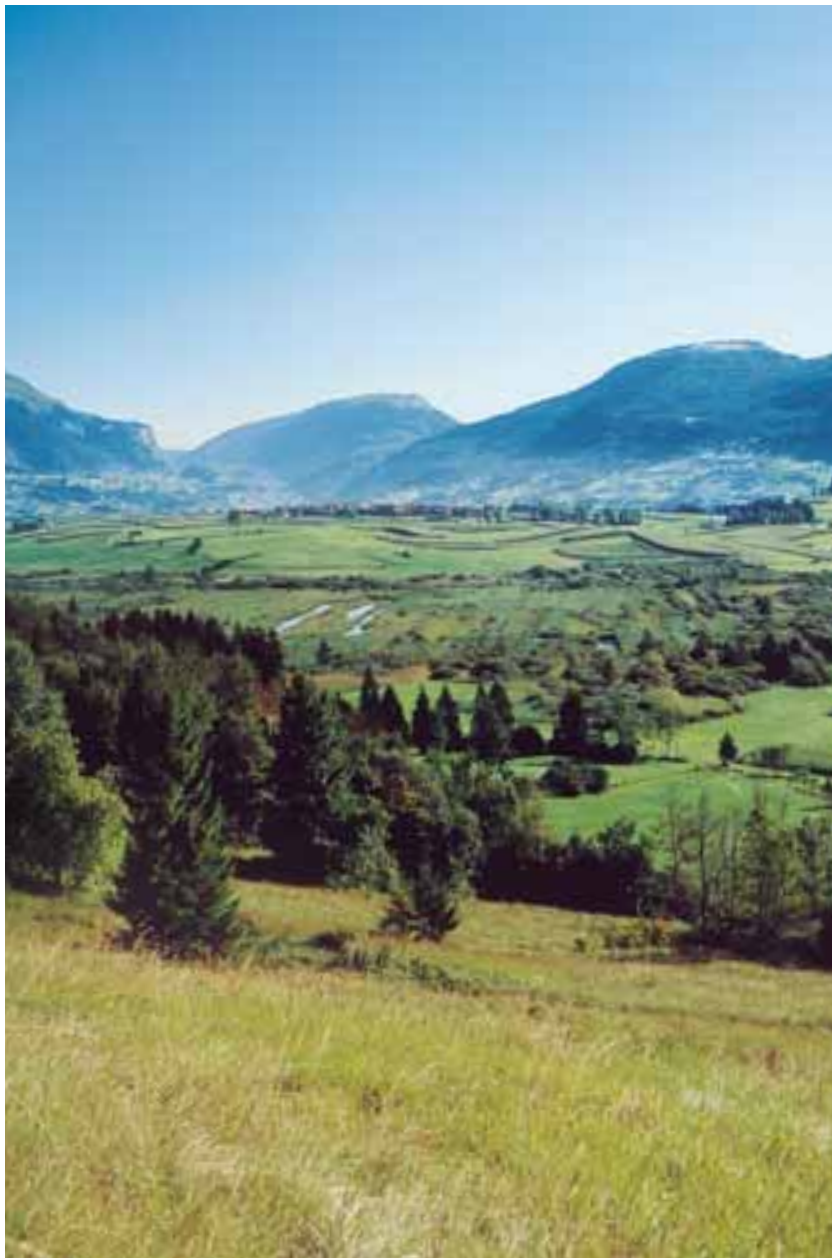
La torbiera di Fiavè (Trentino) porta evidenti i segni della passata attività di escavazione

● EN (minacciato): entità esposta a grave rischio di estinzione in natura nel prossimo futuro; i criteri sono gli stessi utilizzati per la definizione dello status CR, ma con soglie di distribuzione e di consistenza della popolazione più elevate ed una tendenza all'evoluzione negativa della popolazione meno pronunciata.