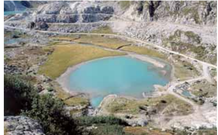
Torbiera al margine di un laghetto alpino in un'area fortemente degradata

Va infine ricordato che in Italia le torbiere sono presenti in condizioni di marginalità rispetto alla loro distribuzione fitogeografica principale legata a climi più freschi e oceanici e pertanto esse sono ancora più fragili dal punto di vista ecologico e rappresentano un valore naturalistico e biologico anche maggiore rispetto ai territori dove sono più diffuse. Le torbiere, in tutti i loro aspetti, rivestono un significato relittuale in quanto la loro formazione e la loro colonizzazione da parte delle varie specie vegetali sembra essere in rapporto con trascorse fasi fredde quaternarie piuttosto che con le condizioni climatiche attuali. Pertanto la scomparsa di questi ambienti nel nostro paese è nella maggior parte dei casi irreversibile in quanto la ricostituzione spontanea potrebbe verificarsi solo con grandi difficoltà su piccolissime superfici.