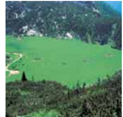
Per caratteristiche e forma è facile associare alle torbiere il concetto biogeografico di “isola”

Le dimensioni e l'eterogeneità ambientale dell'area insulare, viceversa, hanno un'importanza decisiva per il duraturo successo della colonizzazione: più l'isola è piccola, più probabile sarà il rischio di una pronta estinzione. Combinando insieme i diversi fattori, un'isola piccola e remota tenderà a conservare un popolamento molto povero, mentre un'isola grande e prossima al continente, oppure ad isole già abitate, si arricchirà rapidamente di specie, fino a raggiungere un valore massimo di biodiversità, compatibile con le dimensioni e la natura dell'isola stessa. In assenza di fattori estranei, questo numero di specie tenderà poi a conservarsi, per effetto di un bilanciamento reciproco fra nuove