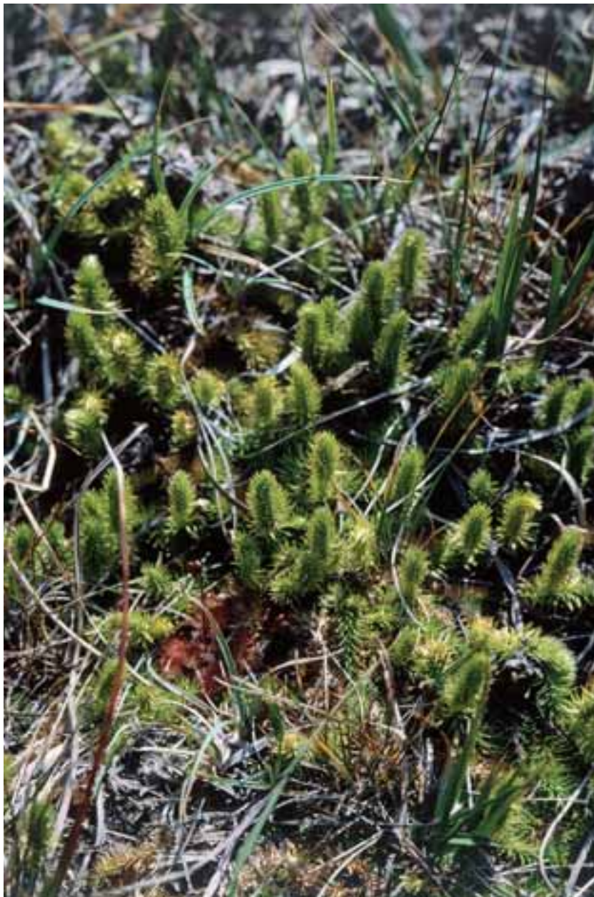
Licopodiella presenta un tipico comportamento strisciante

approfondite in merito alle caratteristiche distributive e popolazionistiche dell'entità cui è attribuito.