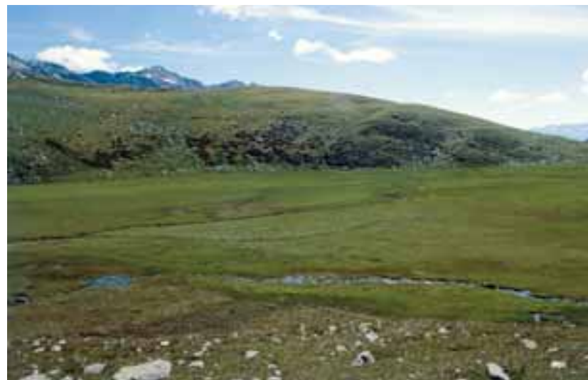
La torbiera della Campagnaccia (Val Malenco, Lombardia)

Poco nota nelle torbiere è anche l'incidenza delle specie di interesse comunitario nonché delle specie dell'allegato IV, meritevoli di particolare tutela, ed importanti anche ai fini del DPR 8 settembre 1997, n. 357, che vieta non solo la raccolta, la detenzione e la commercializzazione di esemplari, ma anche il danneggiamento o la distruzione delle aree di sosta e di riproduzione. Le tor-