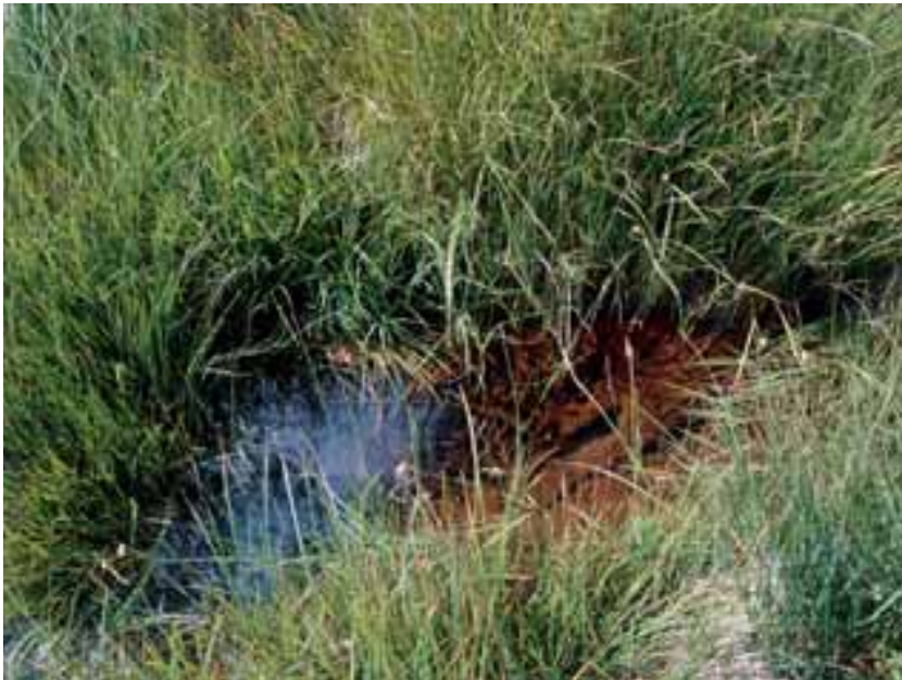
La zona di percorrenza dell'acqua attorno a un cuscinetto erboso