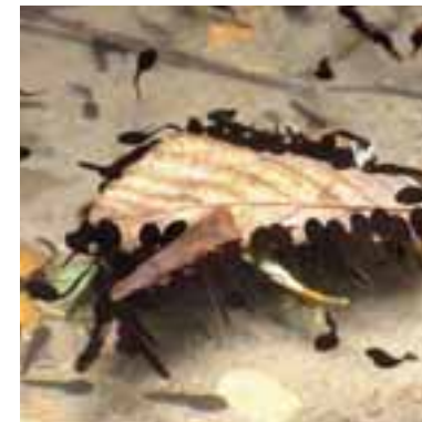
Girini di rospo comune