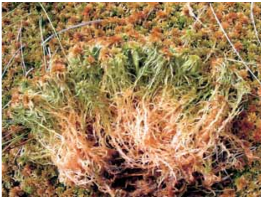
Dettaglio di un tappeto di sfagni

10. Riflessioni conclusive da parte dei ragazzi sulle caratteristiche degli ambienti di torbiera e sulle necessità di tutela di habitat così peculiari.