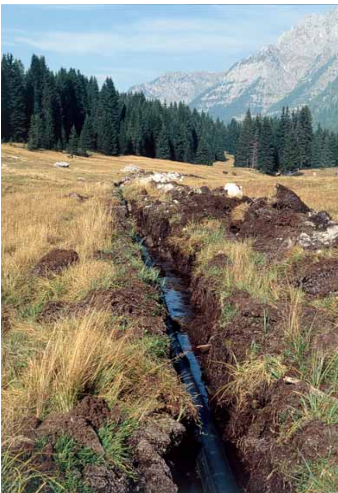
Solco di bonifica che attraversa una torbiera nei pressi di Madonna di Campiglio (Trentino)