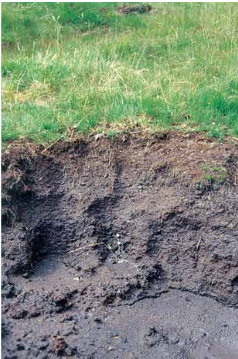
Sezione di suolo torboso