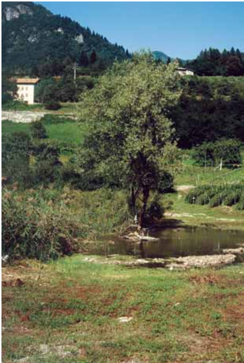
Torbiera fortemente degradata con impianto per il prelievo dell'acqua che ha invaso settori soggetti allo scavo della torba