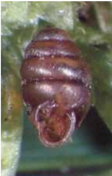
Il gasteropode Vertigo angustior

La rarità delle torbiere italiane e di alcune delle specie che vi abitano, la frammentarietà di questi biotopi, in particolare di quelli appenninici, ed il serio grado di minaccia cui sono soggetti inducono a ritenere che anche le aree non ancora protette in base a direttive comunitarie siano da ritenersi “siti di interesse nazionale” (SIN), per i quali, pur mancando norme attuative di legge che ne impongano la tutela, sarebbe comunque sempre auspicabile una seria azione di conservazione da parte delle amministrazioni locali (regioni, province e comuni) nella cui giurisdizione le torbiere stesse sono localizzate.