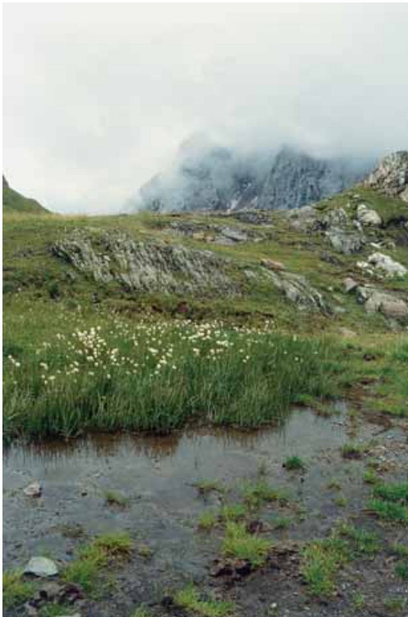
Torbiera con Eriophorum vaginatum (Alpi Carniche, Friuli)