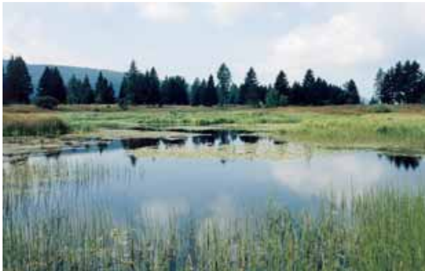
Area sfruttata per la produzione di torba

A livello nazionale però non esistono particolari leggi per la conservazione delle torbiere o, più in generale, dei biotopi umidi e attualmente molte competenze sono decentrate agli enti locali che operano a livelli diversi. Più spesso si ricorre alla protezione di particolari biotopi che ospitano ambienti di questo tipo. Un esempio può essere quello della Lombardia, regione in cui alcune aree protette (riserve parziali botaniche o riserve orientate) sono dedicate alla salvaguardia di aree di torbiera in ambito alpino (Pian di Gembro e Paluaccio di Oga ad esempio) o pedemontano (Torbiera del Sebino). Molte torbiere ricadono poi nell'ambito di parchi regionali, ad esempio il Parco dell'Adamello ed il Parco delle Orobie valtellinesi, oppure del Parco Nazionale dello Stelvio. Alcune specie torbicole sono soggette infine a protezione. È il caso, ad esempio, degli eriofori. Simile è la situazione nella Regione autonoma Valle d'Aosta, dove ambienti di torbiera vengono tutelati in riserve (Lago del Lozon, Lolair), in