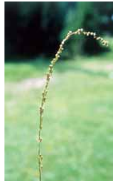
Giuncastrello alpino ( Triglochin palustre )

Nella tabella sono infine presenti specie, il cui areale di distribuzione interessa spesso territori anche fuori delle zone di torbiera, cui viene attribuito uno status di minaccia solo nelle regioni centro-meridionali, che hanno una posizione estrema rispetto al loro areale di distribuzione, generalmente europeo o boreale. In tali casi la specie stessa è in effetti presente, in Italia, in ambienti diversi da quello vero e proprio di torbiera che vi è inesistente in tali regioni.