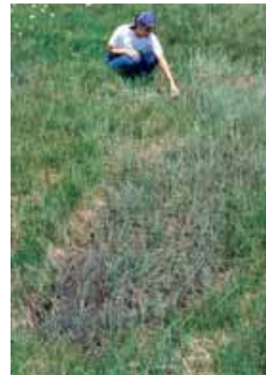
Al variare delle caratteristiche del substrato corrisponde una variazione della vegetazione