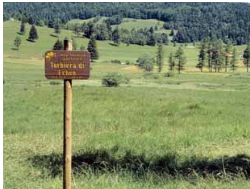
Le torbiere costituiscono interessanti biotopi sempre più valorizzati anche dal punto di vista turistico

1. Reperimento di carte archeologiche regionali o locali, in particolare quelle