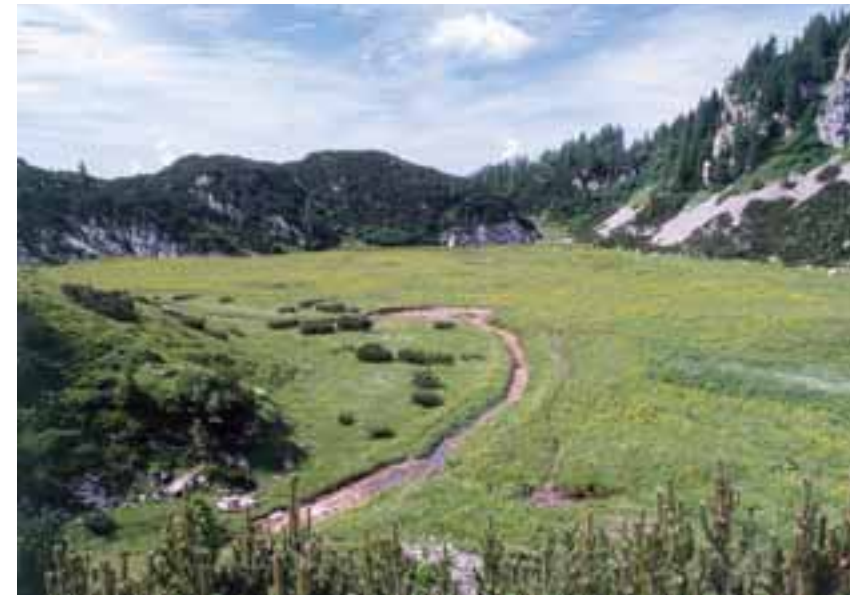
Torbiera della Creta di Aip (Alpi Carniche, Friuli Venezia Giulia)