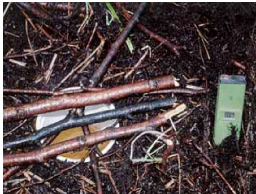
Un esempio di semplici sistemi per campionatura e raccolta dati in area di torbiera