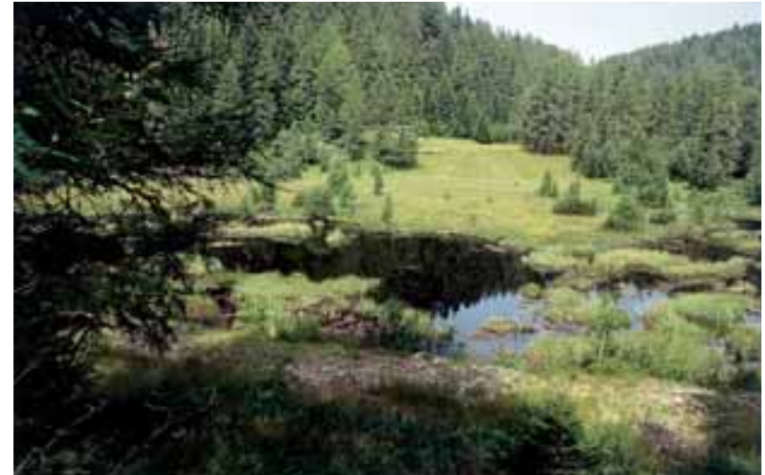
Conseguentemente all'attività di estrazione, vaste porzioni delle torbiere vengono occupate dall'acqua

Non è certo un caso che alcuni fra gli elementi più prestigiosi della fauna entomologica delle torbiere montane italiane, come Agonum ericeti o Chrysochraon dispar , siano noti per il nostro paese solo sulla base di singoli reperti vecchi di un secolo o più. Se, da un lato, può ancora sussistere la speranza che queste specie non siano in realtà estinte sul territorio italiano, la loro scomparsa è peraltro possibile, mentre sono molto tenui le possibilità di un loro eventuale ritorno, a partire da torbiere del versante settentrionale delle Alpi.