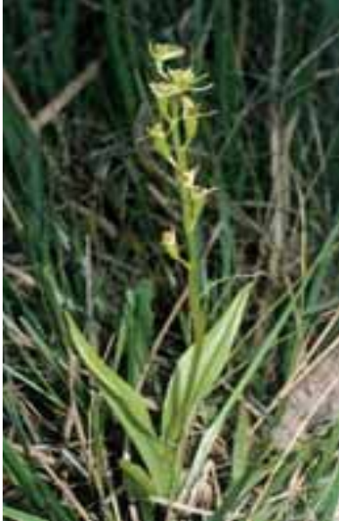
L'orchidea Liparis loeselii

biere italiane ne annoverano solo una piccola parte, nonostante numerose delle specie citate in questo volume siano oggi seriamente in pericolo in Italia. Questo fatto dipende dal concetto stesso insito nella definizione di “specie di interesse comunitario”, che significa specie in pericolo, vulnerabile, rara o minacciata nell'intera Comunità Europea.